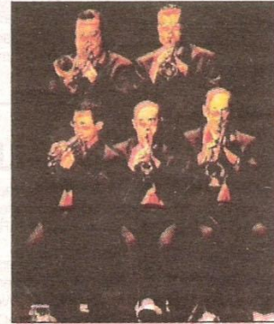
« Sans tambour ni tambour ». (CHRISTIAN GENIN.)

Ce soir, à 20 h 30, au Vingtième Théâtre, 7, rue des Plâtrières, Paris XX e . M o Ménilmontant. Tarif : de 15 à 20 €. Tél. 01.43.66.01.13.