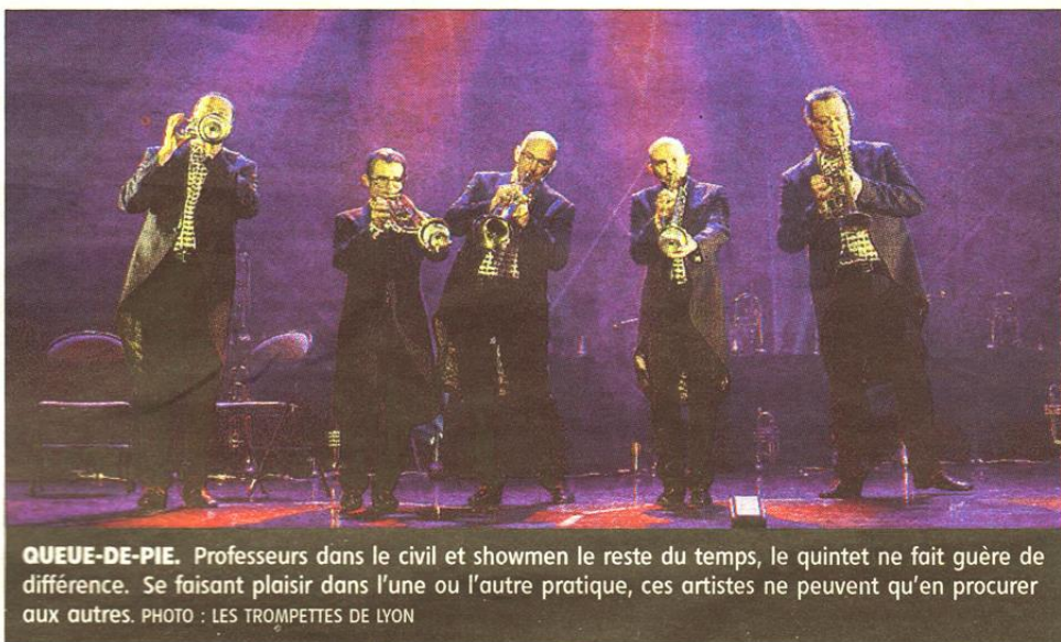
QUEUE-DE-PIE. Professeurs dans le civil et showmen le reste du temps, le quintet ne fait guère de différence. Se faisant plaisir dans l'une ou l'autre pratique, ces artistes ne peuvent qu'en procurer aux autres.

Et sur un plan plus musical, on est parti de notre répertoire qui est aujourd'hui conséquent et on voit comment cela sonne. Ce spectacle sera en quelque sorte bipolaire. Les œuvres choisies seront fidèlement interprétées à la mesure près, après arrangement bien sûr. Et puis, on basculera dans une version plus « éclatée »