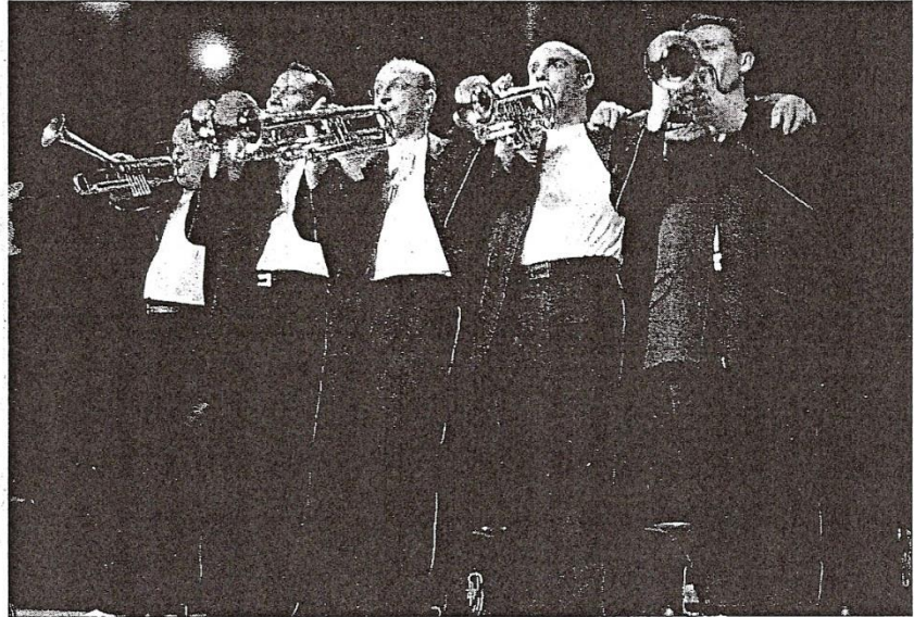
Une bande de bout-en-train talentueux et déjantés, ce sont les musiciens des Trompettes de Lyon : avec eux, qualité et bonne humeur ne sont pas incompatibles.

Parfaitement orchestré. C'est d'ailleurs le Réveil Nouvellois qui a ouvert le bal avec divers morceaux comme les Brigades du Tigre ou Malaguena. Une mise en bouche avant le plat de résistance concocté par les trompettistes : une série de gags en musique qui n'a laissé aucun répit au public venu en nombre. Car les trompettes ont su devenir légères, aériennes, sautillantes et malicieuses pour exprimer les divagations des artistes. Jouant couchés sur le sol, se transformant en juke-box humain, mimant des soldats en pleine guerre ou faisant semblant de s'interpeller, les Trompettes de Lyon ne